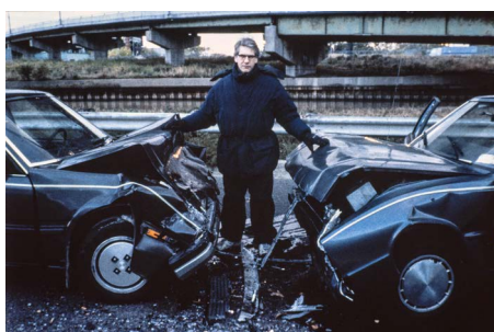
David Cronenberg sur le tournage

mon roman finissait. » L'écrivain a également été très impressionné par les acteurs : « La prestation de James Spader est exceptionnelle ; il a fait son travail avec beaucoup de sensibilité, de force, de curiosité et de lucidité. C'est la première fois que je voyais aussi clairement ce personnage. Quant à Elias Koteas, il parvient à transmettre ce rêve de violence et de sexualité qui pousse Vaughan. » Il renchérit : « Je crois que les rôles féminins de Crash sont très difficiles. Chaque actrice parvient à se sortir superbement de l'étrange logique qui se déroule. Elles se sont véritablement mises à nu, non seulement au sens littéral ou physique, non seulement en exhibant leurs émotions durant les épisodes sexuels, mais en exhibant leurs propres rêves sur ce qu'il adviendra de la sexualité féminine. »