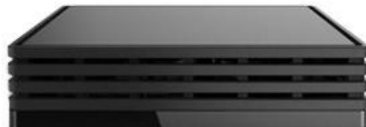
Bbox Miami bouygues

Si vous ne voyez pas l'icône sur le lecteur, castez un contenu depuis youtube pour le faire apparaître, puis retournez sur Le Vidéo Club Carlotta Films et/ou éteignez puis rallumez votre Box.