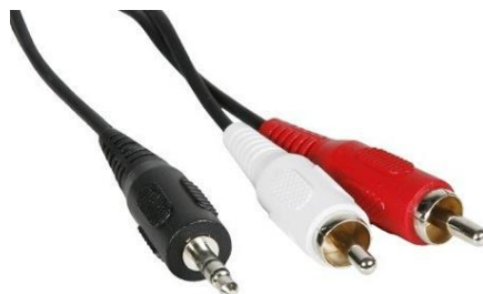
Câble Audio Jack