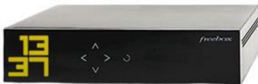
Freebox Mini free

L'écran de votre ordinateur apparaît sur votre téléviseur !