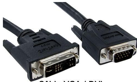
Câble VGA / DVI