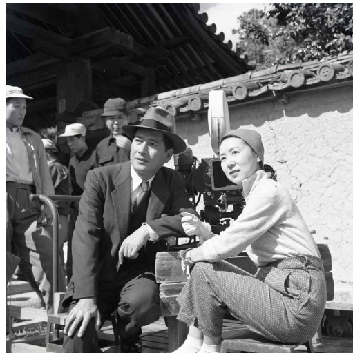
Sur le tournage de La Lune s'est levée (1955)