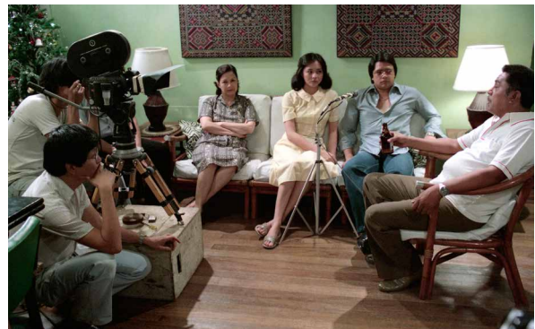
Mike De Leon et son équipe sur le tournage de Kisapmata (1981)